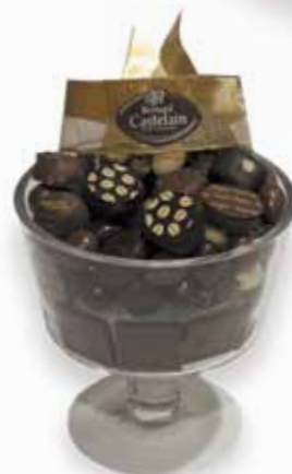
La coupe verre garnie