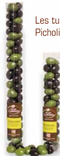
Les tubes Picholine