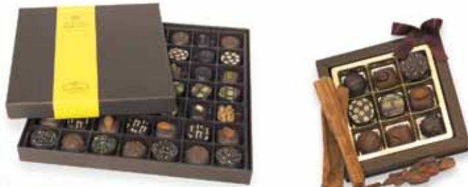
Boîte cloche 960 g

Assortiment équilibré Pâte d'amande, praliné et ganache 85 g 240 g 2/3 noir, 1/3 lait 480 g