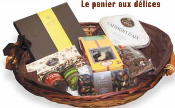
Le panier aux délices

... Retrouvez toutes nos compositions cadeaux en boutique !