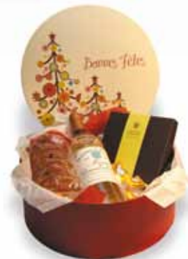
La boîte à chapeau « vin et douceurs »