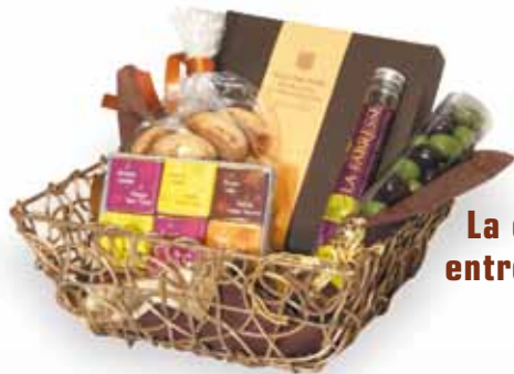
La corbeille entrelacés or

En boutique à Châteauneuf du Pape : notre sélection annuelle de vins, marcs, liqueurs et champagne.