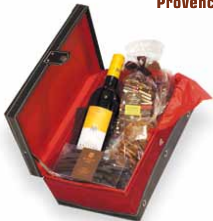
Le coffret velours rouge