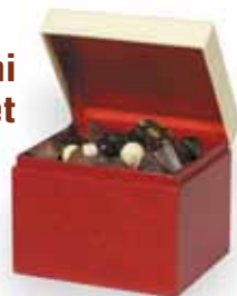
Le mini coffret