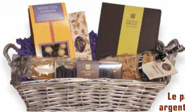
Le panier argent